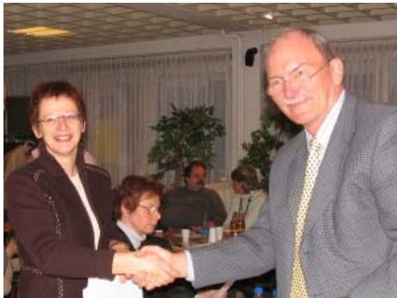
Frau Busch Verein für betreute Schule

- Feb. 2007 Übungsleiterpool Vereinbarung zwischen den OGS Trägern und dem SSV unter Dach und Fach