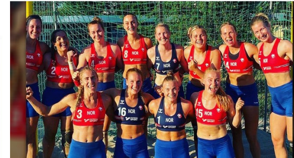
Shorts statt Bikinihose